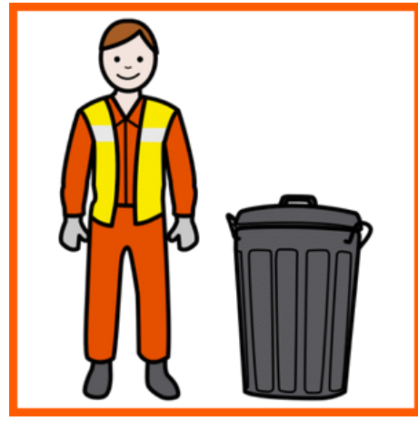
raccogliatore di rifiuti